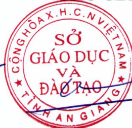
Võ Bình Thư