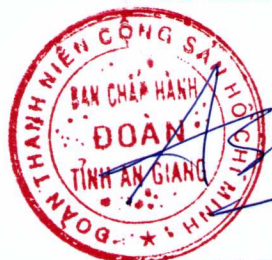
Lâm Thành Sĩ